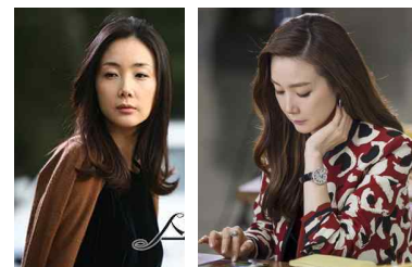
(Figure 31) Sepia cardigan & black one-piece dress, Star's lover, 2008

[Figure 32] 는 2014년 SBS에서 방영되었던 ‘유혹’의 최지우이다. 대기업 중역으로써 화려하면서 파워 있는 이미지를 대담하게 큰 문양의 블라우스를 착용함으로써 보여주고 있다.