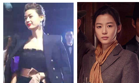
(Figure 16) Black dress, My love from another star, Google image, 2014

[Figure 15] 는 2014년 상영된 SBS 드라마 “별에서 온 그대”의 전지현이다. 극 중 스타이며 영화배우로 나오므로 화려하고 유행의 최첨단을 걷는 의상을 많이 입고 나왔다. 위 사진에서는 큰 칼라의 핑크색 코트 위에 여러 줄의 진주 목걸이를 하고 있다.