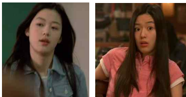
[Figure 10] Blue Denim Shirts, My Sassy Girl, Google image, 2001

[Figure 11] 은 분홍색 면 셔츠를 입고 있는 모습으로 상큼하고 발랄한 이미지이다.