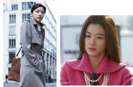
(Figure 14) Trench Coat, Berlin, 2012