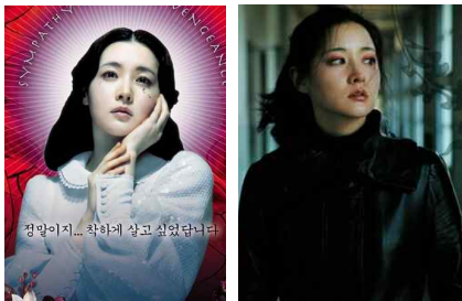
[Figure 5] White blouse, Sympathy For Lady Vengeance, 2005