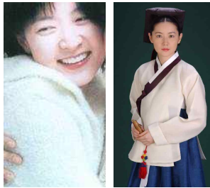
[Figure 3] White Knit Sweater, Flare Skirt, A Gift, Google image, 2001

[Figure 3] 은 2001년 개봉한 영화 ‘선물’에 출연한 이영애이다. 흰색 니트 스웨터로 깨끗하고 순수하며 부드럽고 온화한 여성의 이미지를 나타내고 있다. [Figure 4] 는 본격적인 한류 드라마였던 ‘대장금’ 속의 이영애 모습이다. 조선시대 궁중 상궁들이나 나인들이 입었던 소색(素色) 당의(唐衣)이다. 염색 기술이 발달하지 않았던 당시의 흰색을 소색으로 잘 표현하였다고 평가된다. 당의는 궁중 소례복으로 중국에서 하사해서 입었던 공복으로 당나라 당, 즉 중국의 옷이라는 의미이다. 머리에 쓴 책받침 같은 모자는 당시 의녀들이 착용한 것으로 추측해서 만든 것이다.