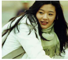
[Figure 9] White Knit Sweater, Siwolae, Google image, 1999

[Figure 10] 은 2001년 개봉했던 영화 ‘엽기적인 그녀’의 전지현이다. 이 작품으로 전지현은 국내는 물론 중국, 일본, 동남아 등에서 스타로 자리매김 하게 된다. 발랄한 여대생을 상징하는 데님소재의 청 셔츠를 입고 있다.