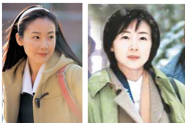
[Figure 27] Begie Coat & high school uniform, Winter Sonata, Google image, 2002

[Figure 27] 과 [Figure 28] 은 2002년 MBC 드라마 ‘겨울연가’의 최지우이다. [Figure 27] 은 첫사랑의 풋풋한 이미지를 나타내고 있으며 고등학교 교복을 착용한 모습이다. [Figure 28] 은 성인이 된 후의 모습으로 짧고 둥근 단발머리에 레이어드로 겹쳐 입은 재킷과 코트가 특이하다. 이 드라마의 윤석호 감독(Yun, 2013)은 의상과 그 의상의 색상을 정해 배우들에게 착용하게 하였다고 한다.