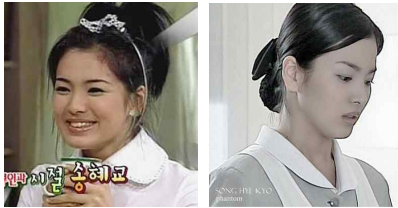
[Figure 18] White blouse, Tailwinds of obstetrics and gynecology, Google image, 1999-2000

송혜교는 1982년 생으로 1996년에 신경 스마트 학생복 모델로 연예계에 데뷔했다. [Figure 18] 은 SBS에서 1998년부터 2000년까지 방영한 시트콤 ‘순풍산부인과’의 송혜교이다. 아직 통통한 볼 살이 있는 10대 소녀로 발달하고 귀여운 이미지를 보여주고 있다.