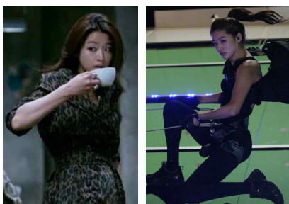
[Figure 12] Animal pattern coat, The Thieves, Google image, 2012

‘엽기적인 그녀’ 이후 전지현은 꾸준히 작품 활동을 해왔으나 히트작을 만들지는 못했다. 그러다가 공전의 히트를 한 작품사진은 [Figure 12], [Figure 13] 으로 2012년 개봉한 영화 ‘도둑들’로 천만 관객을 동원한 작품이다. [Figure 12] 에서 호피 문양의 얇은 코트를 입고 있는 전지현을 볼 수 있다. [Figure 13] 은 바디 수트를 입고 줄을 잡고 있는 전지현이다. 전지현이 영화에서 맡은 역할 줄타기 전문 도둑으로 캐릭터에 맞는 날렵한 이미지를 보여주고 있다.