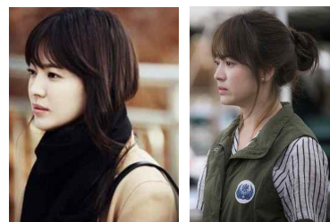
[Figure 24] Black Muffler, Begie Coat, That winter, the Wind Blow, Google image, 2013