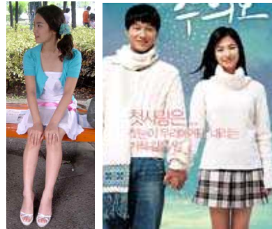
[Figure 22] Sky blue jacket & white one-piece dress, Full house, Google image, 2004

[Figure 22] 는 2004년 방영되었던 ‘풀 하우스’의 송혜교이다. 당시 그녀가 드라마 상에서 했던 헤어스타일과 착용했던 의상은 유행하였었다. 특히 그녀의 양 갈래로 묶는 헤어스타일과 사진처럼 한쪽으로 묶는 스타일, 한쪽으로 묶어 쪽진 스타일 등 특이한 형태들로 센세이션을 일으키며 유행했었다. [Figure 23] 은 2005년 개봉했던 영화 과량주의보의 송혜교로 영화의 주제였던 첫사랑의 이미지와 맞게 부드러운 흰색 니트 스웨터와 머플러를 남녀 주인공이 함께 착용하고 있는 모습이다.