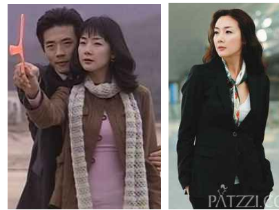
(Figure 29) Pink one-piece dress & sepia coat, Stairways of Heaven, Google image, 2003

[Figure 29] 는 2003년 방영된 ‘천국의 계단’으로 분홍색 원피스 드레스 위에 밤색 코트를 입고 줄무늬 머플러를 목에 두르고 있다. ‘겨울연가’에 이어 청순한 이미지가 지속되고 있음을 알 수 있다. 같은 해 방영되었던 ‘에어시티’에서 최지우는 이전 이미지와 다른 전문직 여성으로써 지적이고 도도한 이미지를 보여주었다. 검정색 테일러드 수트에 스카프를 매치해서 착용하였으며 [Figure 30] 강인하고 단호함 마저 느껴진다.