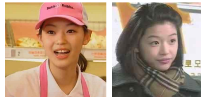
[Figure 7] Uniform, Happy together, Google image, 1999

전지현은 1981년생으로 1997년 패션잡지 에끌의 표지 모델로 연예계에 입문하게 된다. 1998년 SBS드라마 ‘내 마음을 뺏어봐’를 시작으로 2015년 개봉한 영화 ‘암살’에 이르기까지 한해 한편 꼴로 드라마와 영화 작품을 꾸준히 해왔다. [Figure 7] 은 ‘해피 투게더’에서 분홍색 베스킨라빈스 모자를 쓰고 흰 셔츠에 분홍 앞치마를 입은 전지현을 볼 수 있다. 지금으로부터 18년전 드라마로 베스킨라빈스 유니폼을 입고 있지만 배경에는 던킨도너츠가 보여 당시 두 기업이 같은 매장을 사용했던 것을 알 수 있다. [Figure 8] 도 1999년 드라마 ‘해피투게더’의 전지현 모습이다. 단발머리에 검정코트와 체크 머플러를 착용하고 있다. 아래 두 사진은 옛날 10대 후반의 전지현을 볼 수 있는데 둘 다 여학생 이미지로 초기의 풋풋한 이미지가 향후 오랫동안 지속된 배우로 뒤에 나온 2001년 ‘엽기적인 그녀’와 2004년 ‘내 여자 친구를 소개합니다’까지 지속되고 있다.