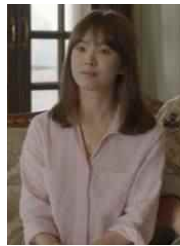
[Figure 26] Pink shirts blouse, The descendant of sun, Google image, 2016

의사로써 의료봉사를 하던 모습으로 평소에 입던 줄무늬 원피스 위에 의료진임을 표시하는 카키색 조끼를 착용하고 있다. [Figure 26] 도 ‘태양의 후예’에서 분홍색 블라우스를 입고 있는 송혜교의 모습이다. 의사라는 전문직 여성으로 군부대에서 의료봉사하고 있는 중에도 여성스러움을 잃지 않는 옷차림을 하고 있다. 특히, 위 사진의 분홍색 블라우스는 방영 다음날 완판 될 정도로 히트 상품이 되었다.