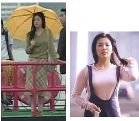
[Figure 20] Beige knit pullover, & check skirt, An autumn's tale, Google image, 2000

[Figure 19] 는 2000년 방영되었던 ‘가을동화’의 송혜교이다. 극중 리조트의 메이드 역할이어서 유니폼을 입거나 Figure 20] 처럼 부드러운 니트 스웨터를 주로 입고 나왔다. [Figure 20] 은 ‘가을동화’의 타이틀로 많이 사용되었던 장면으로 우수에 찬 송혜교가 배에 우산 쓰고 서있는 모습이다. 극의 스토리 전개상 불치병으로 요절하게 되는데 이를 암시하듯 힘없는 부드러운 니트 스웨터를 많이 입고 나왔다. Wikipedia(2014)에 따르면 ‘가을동화’는 일본, 중국, 대만, 태국 등 아시아 각국에서 방영된 후 한류 붐이 시작된 드라마로 평가 하고 있다.