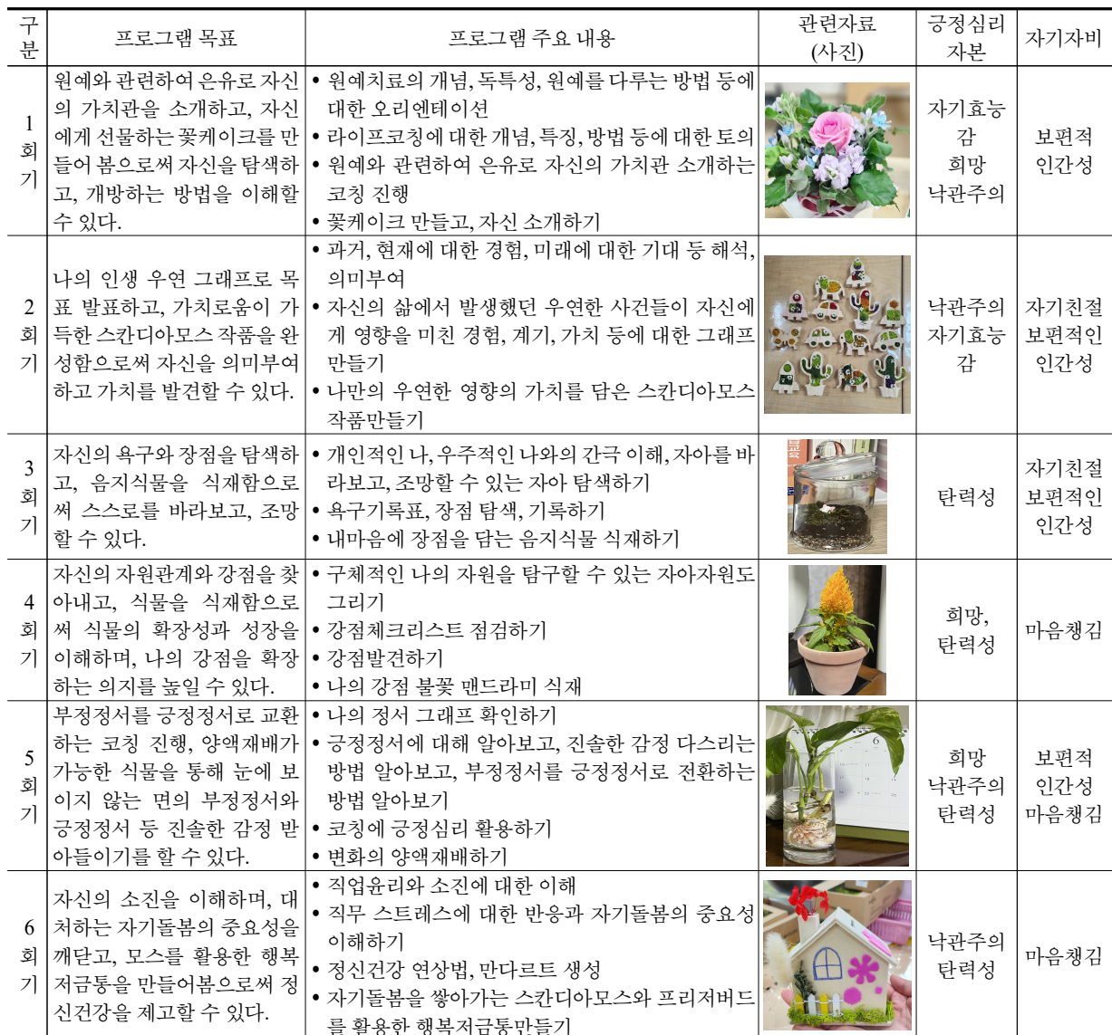
<표 1> 라이프코칭을 활용한 원예치료프로그램의 주요 내용

질 수 있는 내용으로 구성하였다. 더불어 식물을 활용하여 라이프코칭을 적용한 원예치료프로그램이 회기별로 긍정심리자본과 자기자비 변화를 위한 활동의 목표를 실행할 수 있도록 구성하였다. 각 회기별 마무리 단계는 회기별로 프로그램 활동을 통해 느낀점과 새롭게 알게 된 점 및 변화된 부분 등의 경험과 소감을 나누는 시간을 가지고, 참여자 상호간에 긍정적인 스트로크를 통해 지지, 격려하며 마무리하는 시간을 가지며, 리뷰를 작성하는 시간을 포함하였다. 각 회기별 활동 목표와 주요 내용은 <표 1>과 같으며, 회기의 구체적인 내용의 예는 <표 2>와 같다.